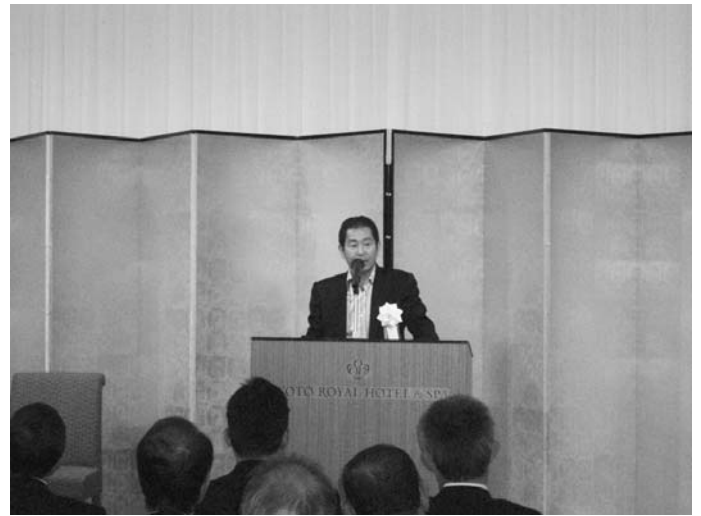
元プロレーシングドライバー 土屋 圭一氏(講演会)