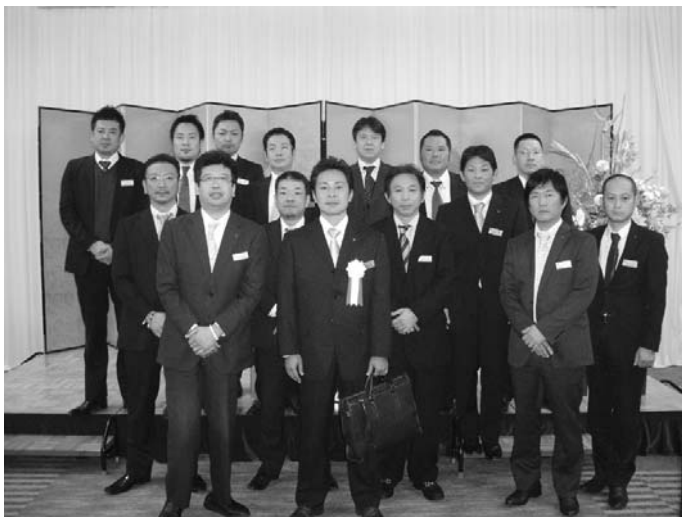
みんなで記念撮影