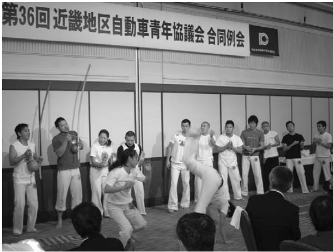
アトラクション「カポエラ」の演武 (懇親会)